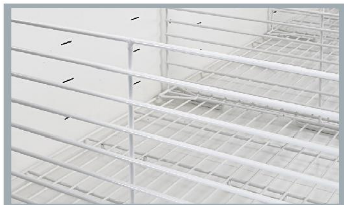
WIRE PRODUCT DIVIDER