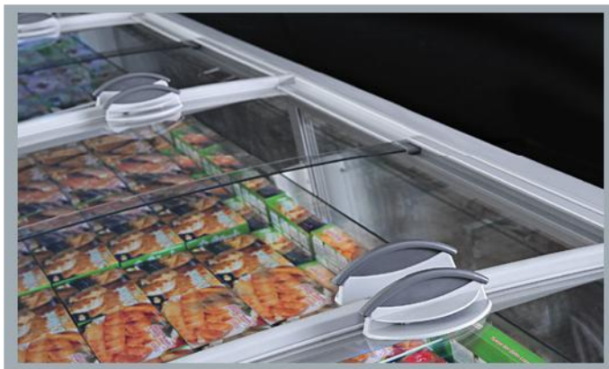
SLIDING GLASS PANEL